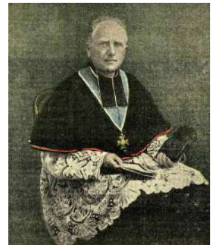
Mgr Henri Binet Evêque de Soissons (16 juin 1920)

« à 9h00 , automobiles et voitures sillonnent la route de Samoussy. Le clergé, la chorale, s'y rendent pour une bénédiction de cloches. »