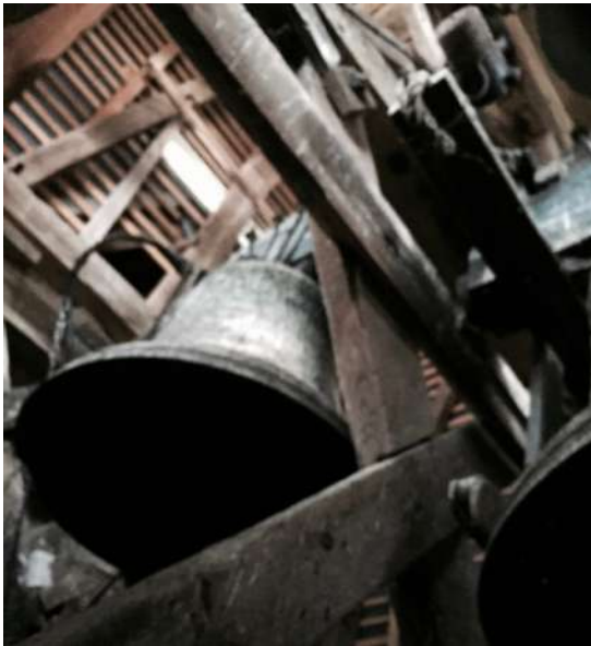
Les 3 cloches de l'Eglise St Remi de Gizy