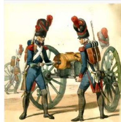
Artillerie à pied de la Garde impériale